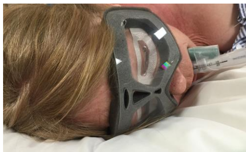
Paciente con NoPress. También lleva EyePros (de Innovgas) para mantener los párpados cerrados.

NoPress™ es un protector de espuma y plástico rígido especialmente diseñado para proteger los ojos de los pacientes anestesiados de la presión aplicada de forma externa. Gracias a su diseño unitario patentado y a su dispositivo de flexión en la línea media, resiste una elevada carga de presión a la vez que se amolda a la cara del paciente.