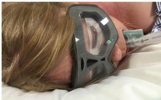
Un patient porteur de NoPress, également porteur d'EyePros (par Innovgas) permettant de maintenir ses paupières fermées.

NoPress™ est un protector de espuma y plástico rígido especialmente una protección ocular en mousse et plastique rigide spécialement conçue pour protéger les yeux du patient anesthésié contre toute pression externe. Son design patenté unique et son système de flexion à la ligne médiane lui permet de résister à des charges de haute pression tout en épousant parfaitement le visage du patient.